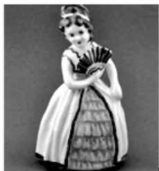
Figurilla de cerámica Lota

El enfoque de género en los museos permite soportes y experiencias (muestras, visitas guiadas, material didáctico) que nos dan la posibilidad de reflexionar respecto a la construcción de género presente en las diferentes materias que abordan los museos, en este caso, en las artes decorativas, cuestionando las elaboraciones y las representaciones que tradicionalmente se han hecho de hombres y mujeres visibilizando el aporte que cada uno de ellos y ellas han realizado a las ciencias, las artes, la historia y el patrimonio cultural en general.