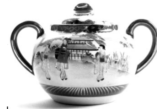
Tetera japonesa con imágenes femeninas

¿Qué diferencias principales tiene con las imágenes de hombres?